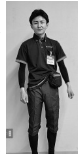
足のケガ防止のために半ズボン着用時にはスパッツを穿きます

して主に共同購入事業（宅配の配送現場）で働くスタッフを対象に、飲料の配布などをおこなっています。初めて飲料配布をした当時は、夏場に2ℓのペットボトル1本のみでしたが、その後、配布期間の延長とともに、支給本数も増加していきました。そして2025