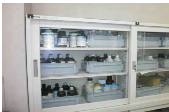
薬品棚のなかでは、液体は粉末類と区別されて、地震などで飛び出さないように、深いトレイに入られている。