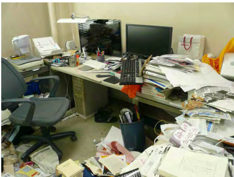
整理されない研究室と、いまにも倒れそうな研究室の本棚