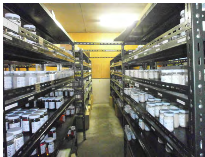
薬品類はすべて、地震対策を考えて棚を設けている。右は試料、サンプルの保管。同じように飛び出さない棚のある棚にしている。