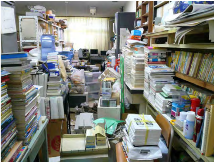
ここは別の高校の化学の教員の部屋。