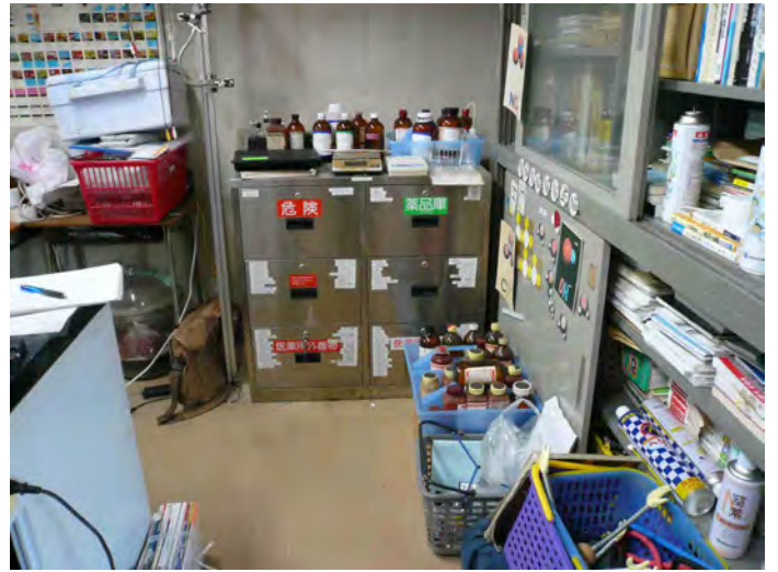
高校の化学の薬品が整理されずに棚の外にでている。