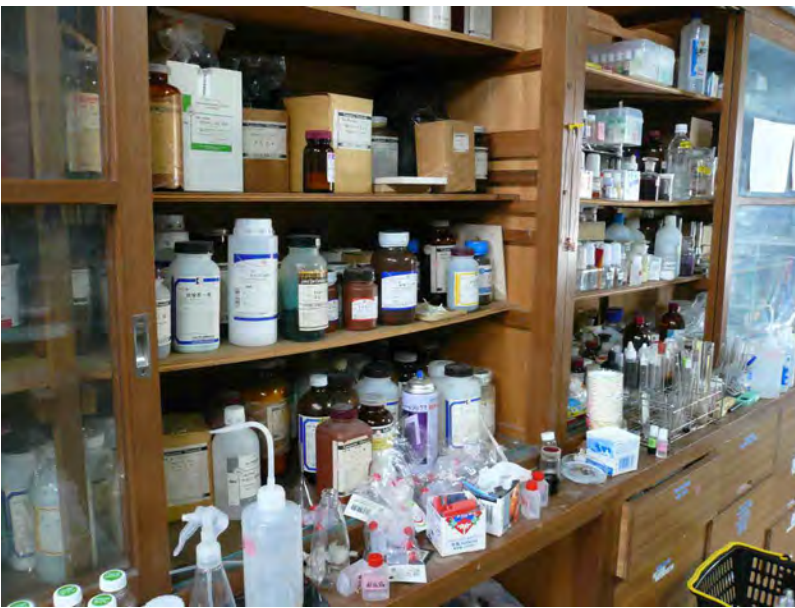
別の薬品棚の様子。整理されていない。危ない。